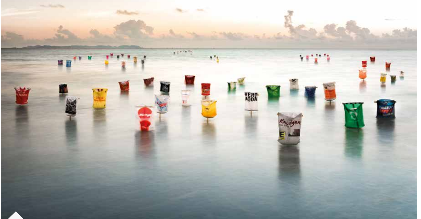
Fotoprojekt: Pick It Up | Plastic Army